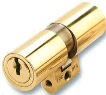
Cilindro SEA 3 / SEA 23