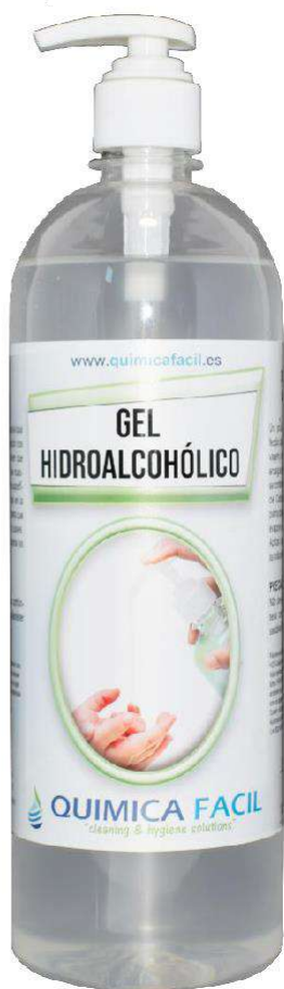
1000 ml con bomba