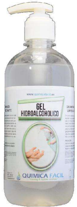
500 ml con bomba