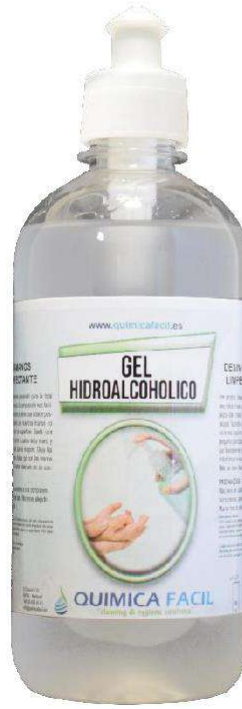
500 ml con PUSH